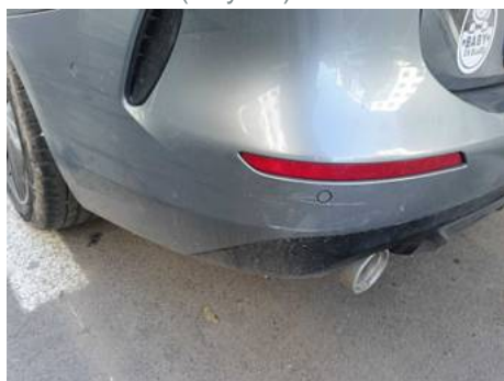
Bouclier arrière (Rayure)